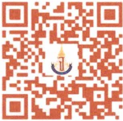
ช่องทางรายงานตัวและยืนยันสิทธิ์ ฯ